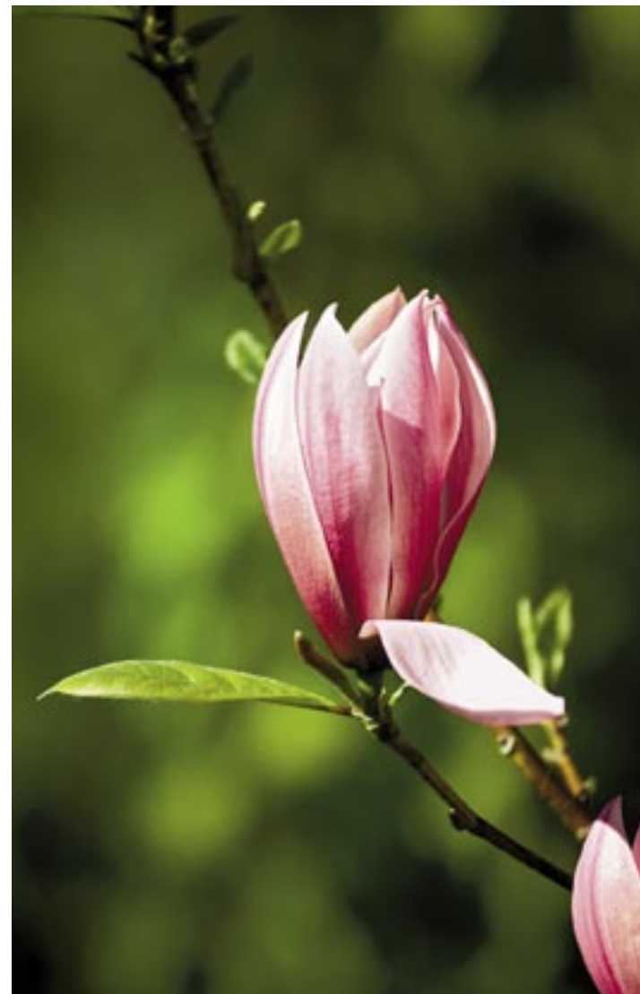
BLOMMAR I MAJ. 'Galaxy' blommar på bar kvist i maj och är härdig till zon 3.