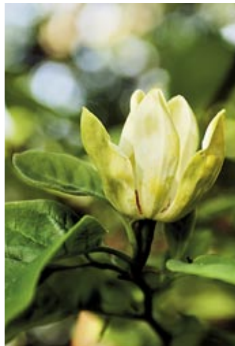
LJUSGUL. Gul poppelmagnolia, Magnolia acuminata var. subcordata . Härdig till zon 3. VÄND ►

– Drömmen vore en blommande allé av junimagnolior längs Sveavägen! Och kanske kunde man plantera magnolior på Observatoriekullens sluttningar när den nya delen av stadsbiblioteket ska byggas ... ■