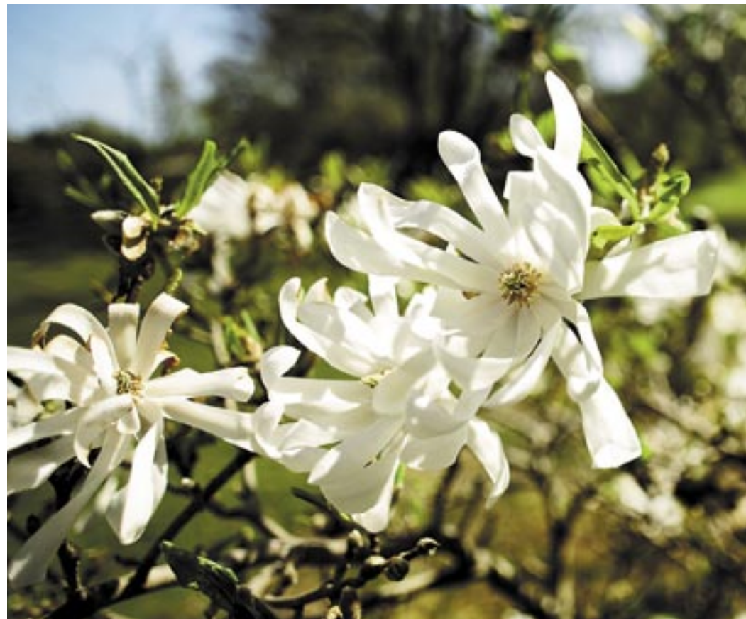
BLOMMAR LÄNGE. Stjärnmagnolian 'Centennial' slår ut tidigt och står i blom en hel månad. Härdig till zon 3.