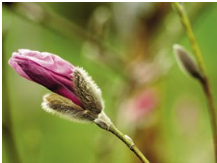
PÅLSKRAGE. Magnolians knoppar skyddas av ljuvligt mjukludna fjäll.