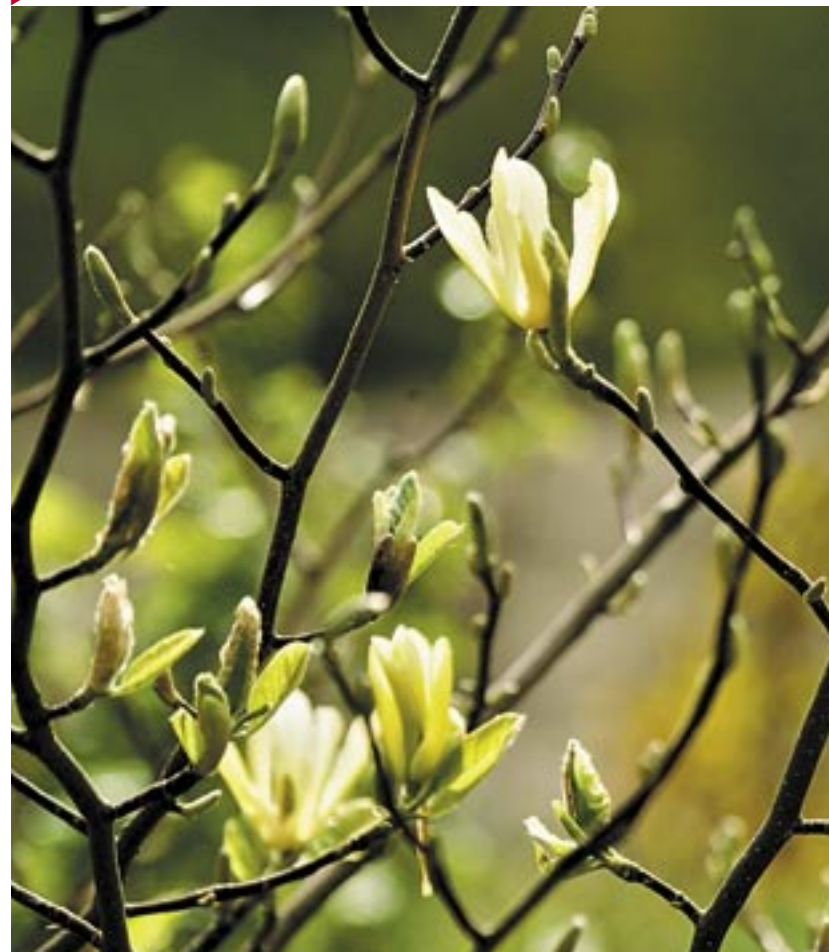
FJÄRILSVINGAR. När magnoliasorten 'Butterflies' blommar på bar kvist ser det ut som om en flock citronfjärilar har slagit sig ner i trädet. Härdig till zon 2-3.