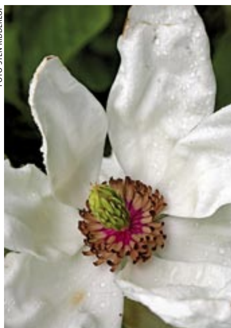
DOFTANDE FAVORIT. Kryddigt med en touche av ananas doftar Stens favorit Magnolia x wieseneri . Härdig till zon 2.

Jag planterar ut magnoliorna som juveler i min trädssamling och den naturliga lövskogen med glasbjörk, klibbal, hägg och asp som växer här på Svartlöga, säger Sten Ridderlöf.