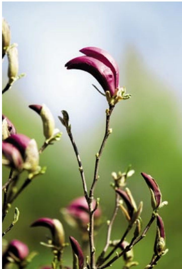
PURPURRÖD. Söta liljemagnolian 'Susan' blommar i maj-juni. Knopparna är mörkröda men kronbladen ljusnar när de slår ut. Vanlig i trädgårdshandeln. Härdig till zon 3 eller 4.